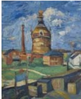
Herbert Boeckl, Wasserturm in Wien-Favoriten , 1930, Kunstsammlung des Landes Kärnten/MMKK