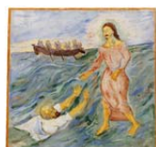
Herbert Boeckl, Errettung Petri aus dem See Genezareth , 1928, Fresko, Dom zu Maria Saal, Kärnten

Ticket: € 15,- (inkl. Eintritt, Führungen und Busfahrt) | Anmeldung erforderlich!