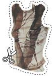
Grafik: Alice Burger

Eintritt: € 13,- (inkl. Material, Jause) | Anmeldung