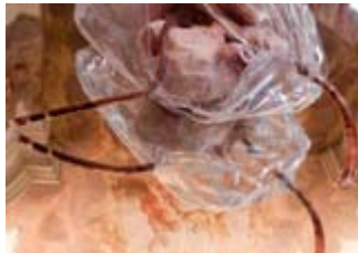
Marlies Liekfeld-Rapetti: Zucht , 2010, Ausstellungsansicht (Detail), Foto: Ferdinand Neumüller