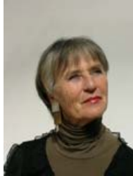
Marlies Liekfeld-Rapetti

In Kooperation mit dem Katholischen Akademikerverband Kärnten.