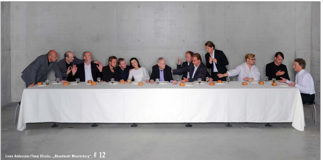
Irene Andessner/Timm Ulrichs, „Abendmahl Mönchsberg“, Motiv # 12

Edition: 70 x 140 cm und 100 x 200 cm, limitiert auf insgesamt 4 Exemplare, Doppelsignatur Andessner/Ulrichs