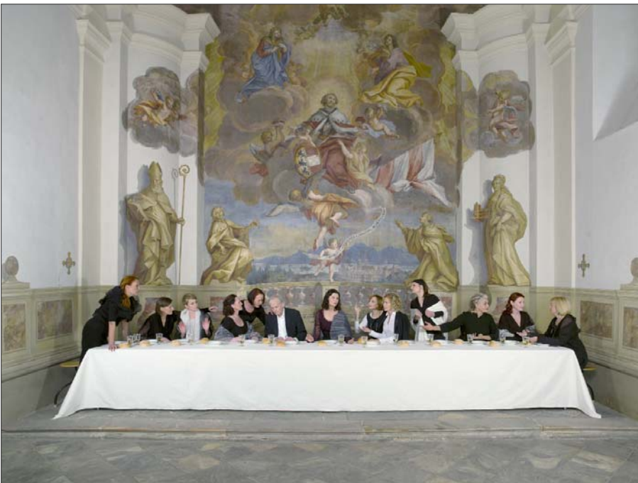
Irene Andessner/Timm Ulrichs, „Abendmahl MMKK“, Motiv # 03

Edition: 1 Unikat-Leuchtkasten 124 x 172 cm; 3 C-Prints 70 x 100 cm, Doppelsignatur Andessner/Ulrichs