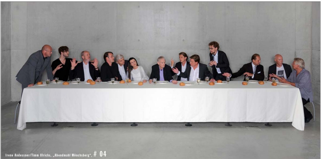
Irene Andessner/Timm Ulrichs, „Abendmahl Mönchsberg“, Motiv # 04

Edition: 70 x 140 cm und 100 x 200 cm, limitiert auf insgesamt 4 Exemplare, Doppelsignatur Andessner/Ulrichs